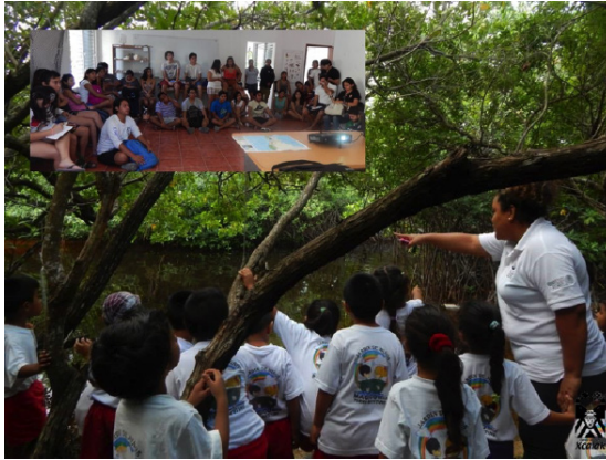
FIGURA 8. La educación ambiental es una de las herramientas fundamentales de la conservación. En la imagen se observa a un grupo de niños de preescolar conociendo los ecosistemas del PNAX y a un grupo de estudiantes de licenciatura conociendo las acciones de conservación.