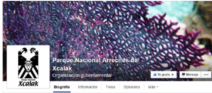
FIGURA 9. www.facebook.com/PNArrecifesdeXcalak

se tiene una interacción directa y dinámica con los usuarios a través de las herramientas de esta red social (figura 9), y NaturaLista ofrece a los seguidores una galería de imágenes sobre su diversidad biológica. Así se pone de manifiesto la importancia de los ecosistemas del PNAX.