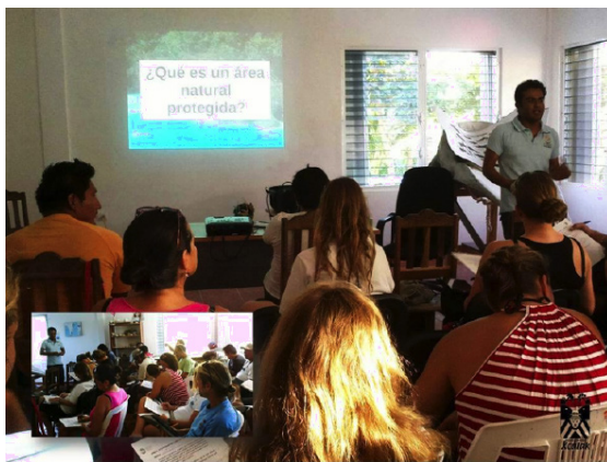
FIGURA 6. El curso de guías y capitanes se imparte a los prestadores de servicios turísticos del PNAX para reforzar el conocimiento sobre las ANP en México

sean ellos quienes repliquen esta información con las personas que visitan el PNAX con fines recreativos y turísticos (figura 6).