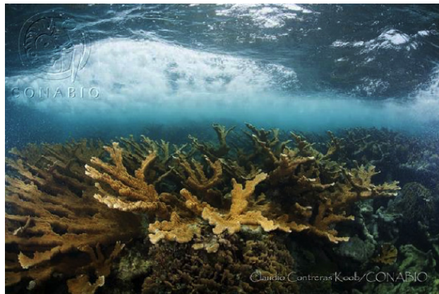
FIGURA 3. En la imagen se aprecia al coral cuerno de alce en el PNAX, una de las especies ecológicamente importantes por participar en la formación inicial de los arrecifes de coral

Diploria spp. ), estrella ( Siderastrea spp. ), dedos ( Porites spp. ), cuerno de ciervo ( Acropora cervicornis ) y cuerno de alce ( A. palmata ; Conanp, 2004; Ruiz-Zárte y Arias-González, 2004); estos dos últimos corales son considerados los principales constructores del arrecife (Lighty, Macintyre y Stuckenrath, 1982). Además de ello, el PNAX resguarda el segundo parche de coral cuerno de alce más grande de Quintana Roo (García-Salgado, Nava-Martínez y Samos-Falcón, 2013) (figura 3).