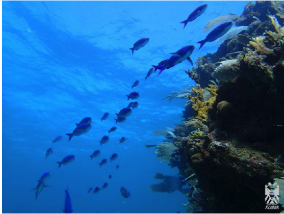
FIGURA 2. Arrecifes de coral en la zona núcleo en el norte del Parque Nacional Arrecifes de Xcalak