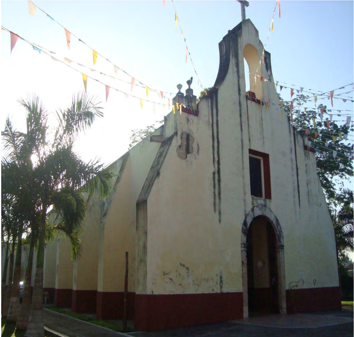
Vista lateral de la Parroquia de San Joaquín