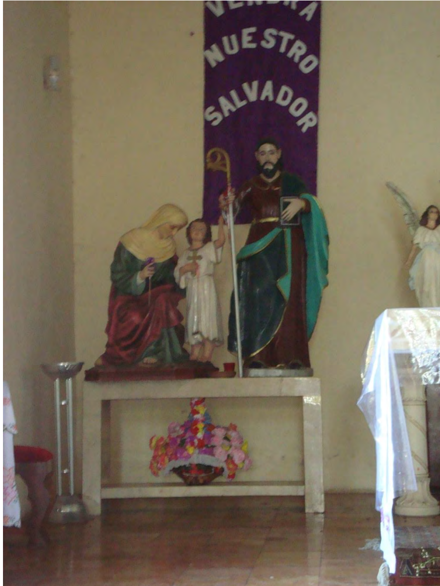
Imagen del santo patrono “San Joaquín”