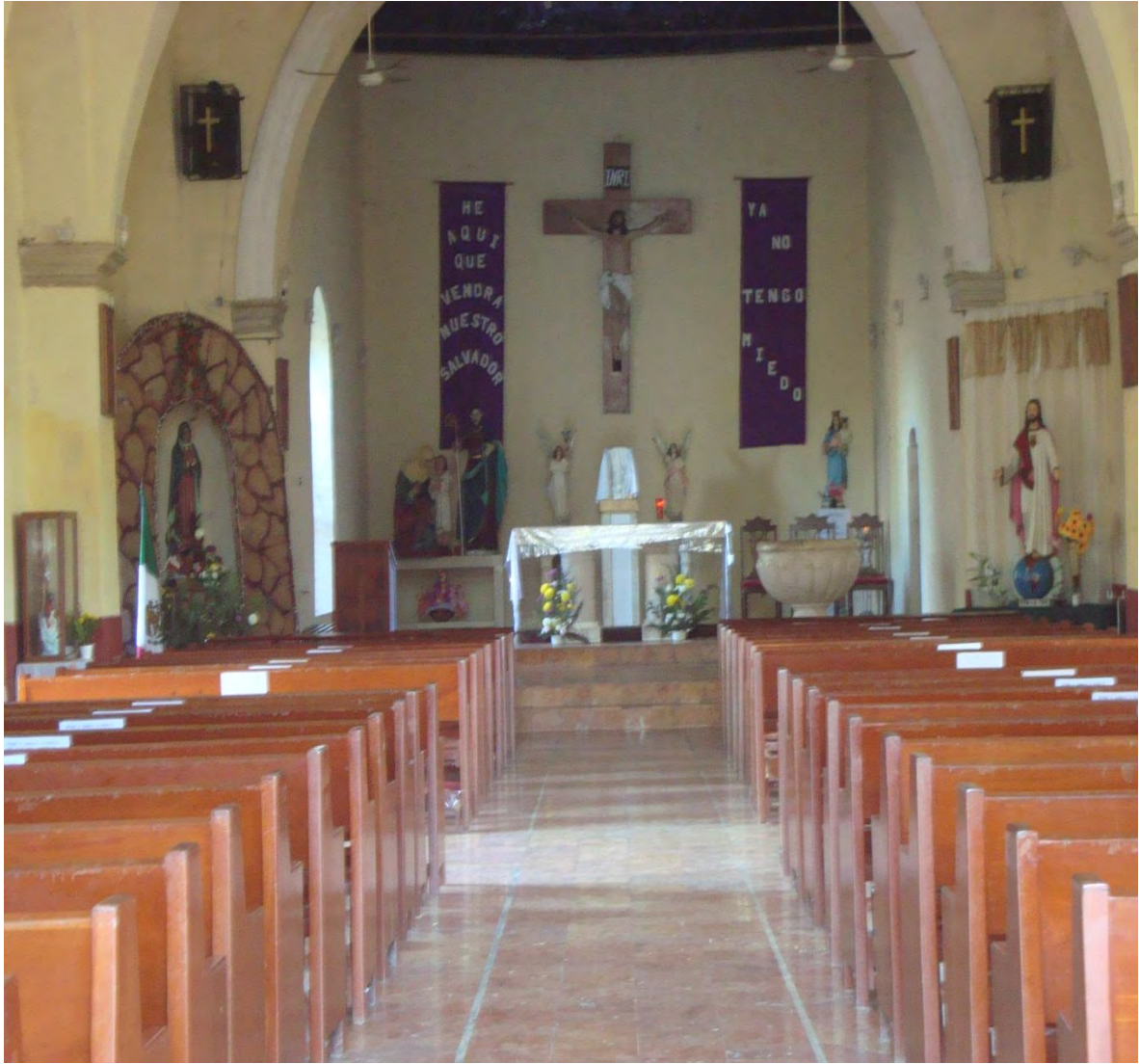
Parroquia de San Joaquín Fotografía 2, de Karely Álvarez