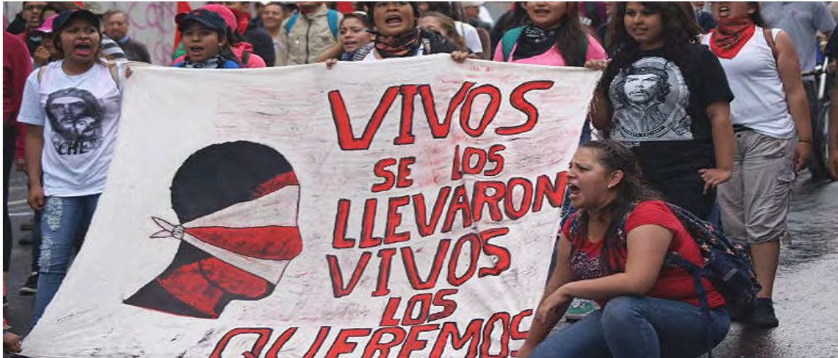
Figura 3. Ejemplo de consigna en manta.