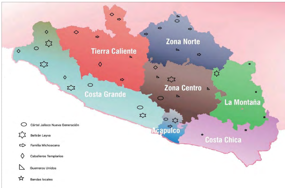
Figura 2. Geografía delictiva.