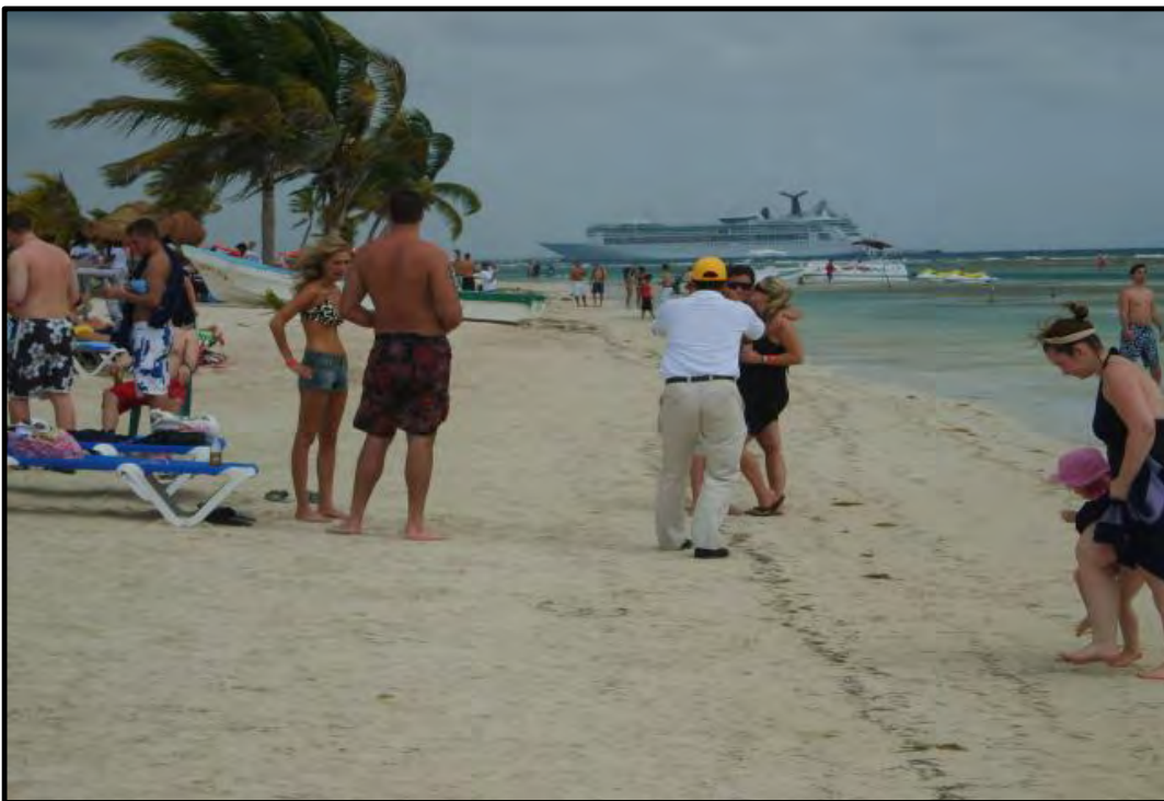
Sol, finas arenas del Caribe Mexicano son las mayores demandadas por el turismo: Mahahual la Costa Maya.