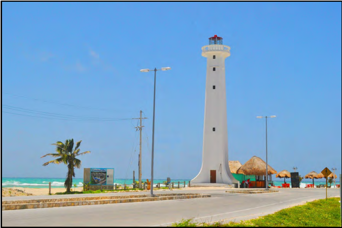
Fuente: Imagen encontrado en la red: Faro de la entrada a la Costa Maya de Mahahual