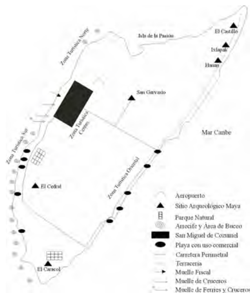
Mapa 1. Zonas de Apropiación Turística

tipo rocoso con poco valor de uso. En la costa oriental se encuentra localizada la ZAT Oriental, la cual cuenta con seis playas de uso recreativo turístico, utilizadas por la población local principalmente los fines de semana; a lo largo de este espacio costero se ubican pequeños comercios dedicados a la venta de alimentos y bebidas (Ver Mapa 1).