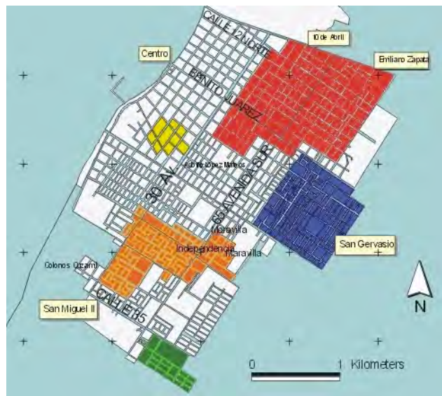
Mapa 2. Zonas de Atención Prioritaria