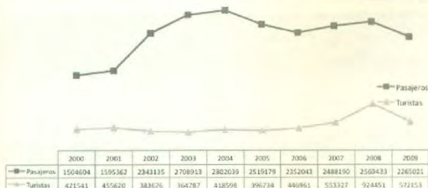
GRÁFICO 2. VISITANTES Y TURISTAS EN COZUMEL 2000-2009

Fuente: elaboración propia con datos de la Secretaría de Turismo de Quintana Roo (2010).