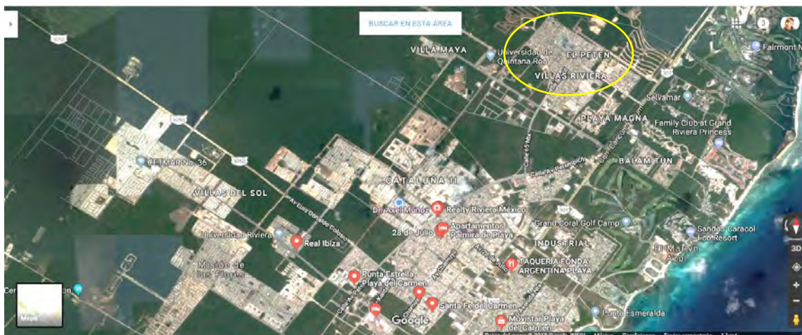
Figura 4. Mapa de Playa del Carmen ubicando El Peten.

El círculo amarillo identifica la zona de La Guadalupana, incluido El Peten.