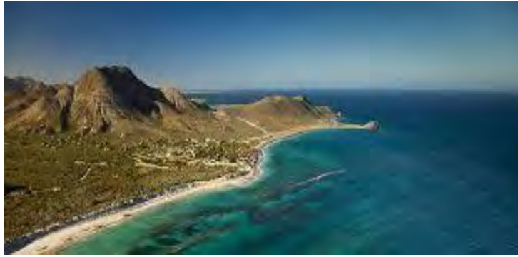
Figura 7. Cabo Pulmo en la actualidad, Baja California Sur