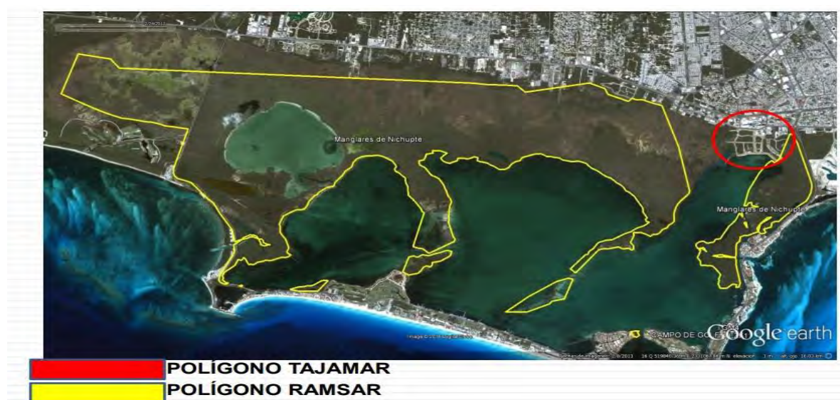
Figura 8. Mapa de tajamar en Benito Juárez, Quintana Roo

Fuente: Recuperado Secretaria de Turismo (2006) Malecón Tajamar Desarrollo responsable apegado a derecho.