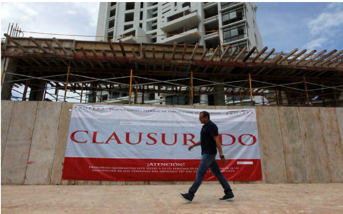
Figura 10. Clausura del desarrollo inmobiliario INFINITY en el Malecón tajamar