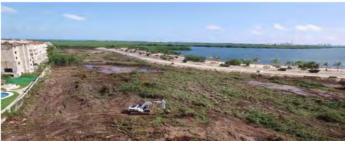
Figura 9. Resultado de la intrusión de maquinaria en el Malecón Tajamar