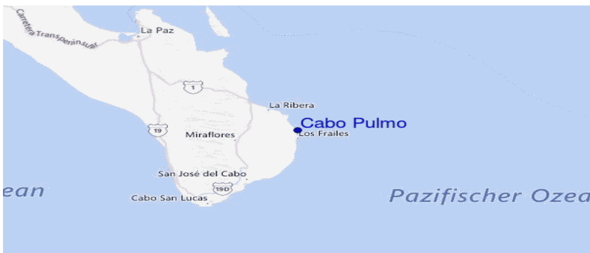
Figura 6. Mapa de Cabo Pulmo, Baja California Sur

A continuación, en la figura 5 y 6 se presenta el mapa de Cabo Pulmo y el mapa actual de Cabo Pulmo.