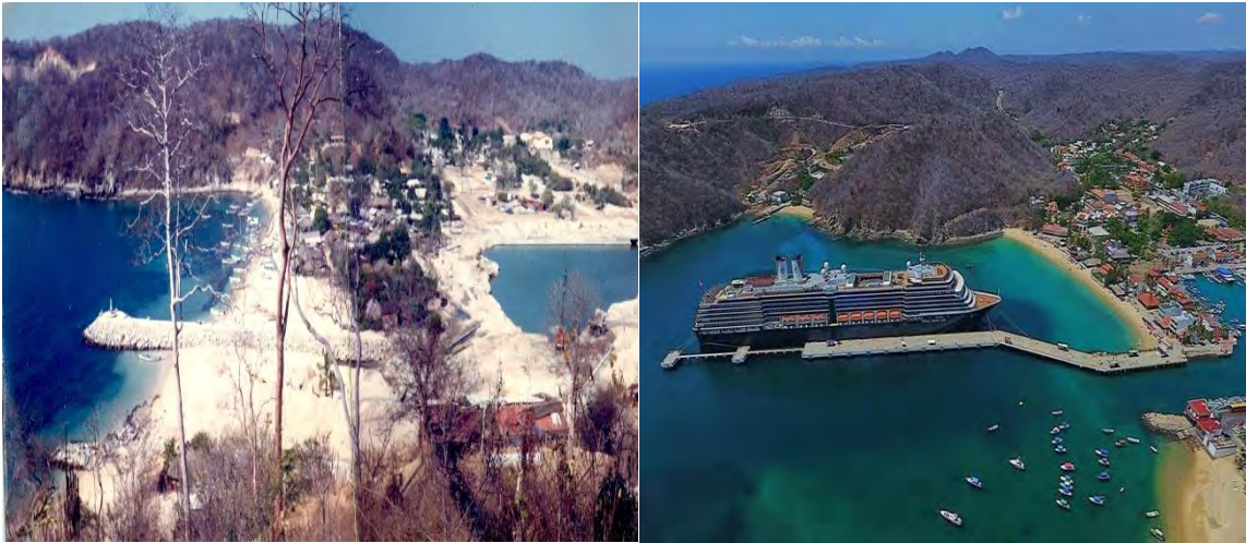
Figura 4. Antes y después de la bahía de Santa cruz en Huatulco, Oaxaca