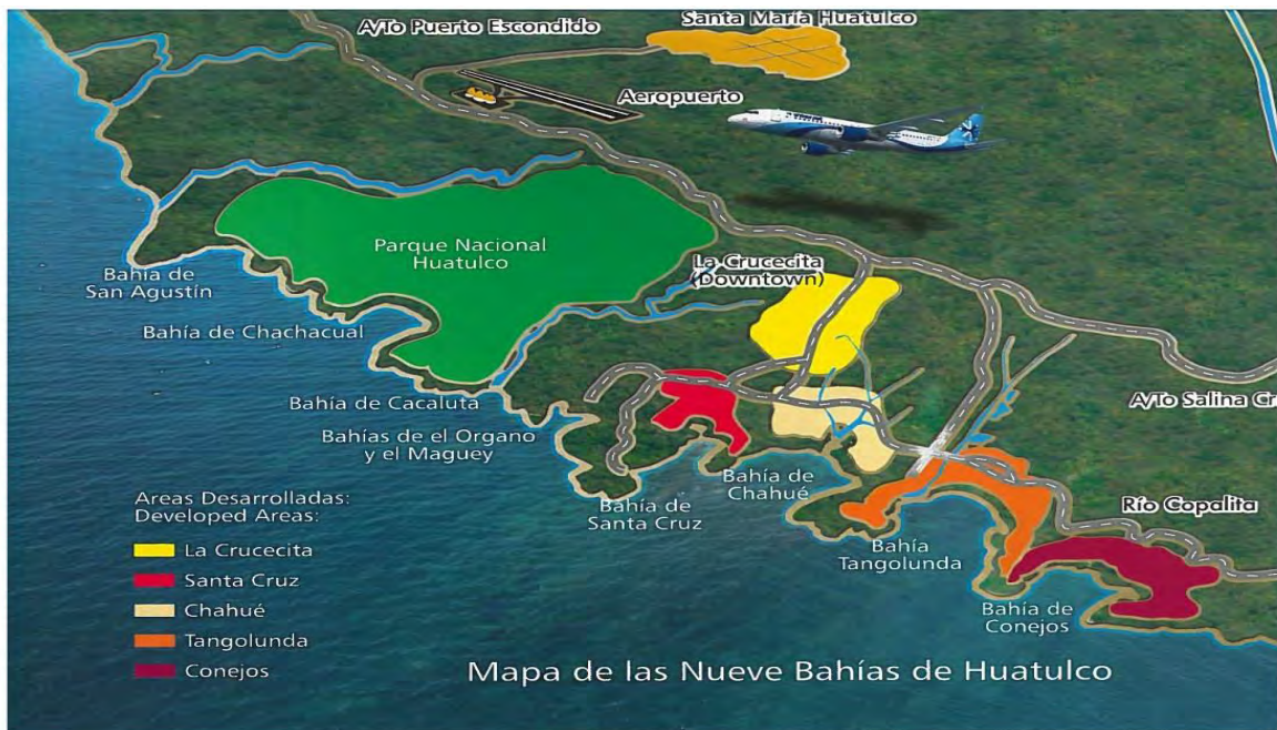
Figura 5. Mapa de las 9 bahías de Santa María Huatulco, Oaxaca