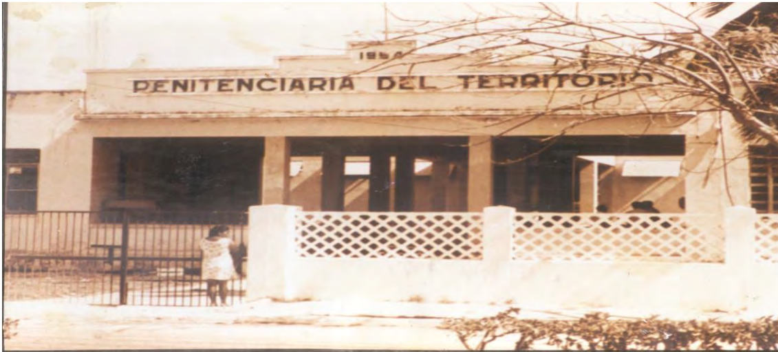
Imagen 1: Antiguo Centro de Readaptación Social de Chetumal, 1964