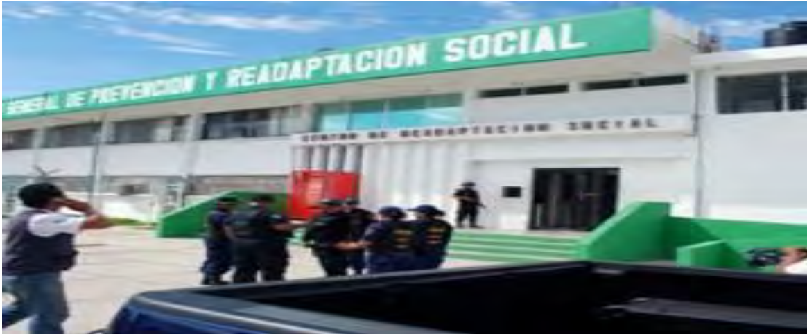
Imagen 2: Actual CERESO de Chetumal 2016, Quintana Roo., Fuente; tomada por la autora de esta Monografía en el CERESO DE Chetumal.

Inicialmente el Centro Penitenciario de Chetumal, (antes Centro de Reinserción) no contaba con un área administrativa, ya que los recursos financieros, materiales humanos eran manejados por la alcaldía del mismo.