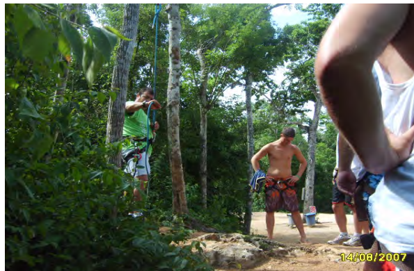
Imagen 4.

Una vez ya en el parque inician con alguna de las actividades antes indicadas, esto depende de la hora en que lleguen al lugar, antes de cada una de las actividades se les proporciona equipo especializado para la realización del mismo, en el caso del rappel y tirolesa: casco, guantes,