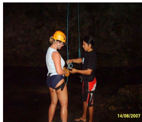
Imagen 3.

Asistentes de guía: apoyan al guía a proporcionar el equipo especializado a los invitados y agilizar la prestación del servicio, así como del cuidado y organización del equipo durante el servicio y desenganchar a los invitados en las tirolesas y rappel (ver imagen 3).