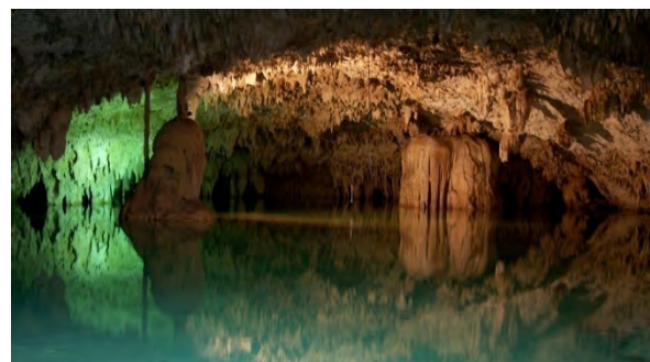
Imagen 6.

encuentran dentro de la clasificación de ecoturistas casuales ya que solamente visitan incidental y brevemente el área (Deffis, 1998), las otras actividades que son complementarias a este recorrido son el rappel y las dos líneas de tirolesas, a pesar de ser estas de aventura se tiene un contacto directo con la naturaleza, una tirolesa atraviesa la selva por las alturas teniendo con ello la apreciación de la flora aunque de una manera muy somera y la otra se inicia desde la superficie hasta internarse a un cenote en donde se acuatiza (ver imágenes 5 y 6), en el caso del rappel el descenso se realiza al interior del cenote por lo que se observan dos diferentes entornos al iniciar en la selva y terminar dentro de una bóveda al interior de un cenote. En