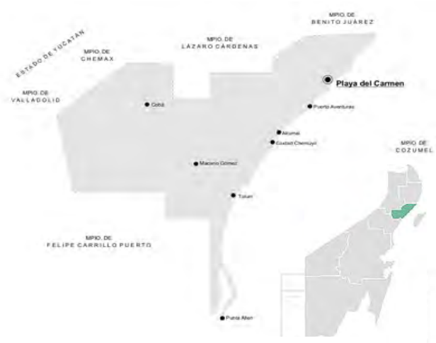
Imagen 2.

Solidaridad: es un municipio del estado mexicano de Quintana Roo y uno de los más jóvenes en el país al haberse formado el 28 de julio de 1993 por decreto del Congreso del Estado durante el gobierno de Mario Villanueva Madrid. Su cabecera es la ciudad de Playa del Carmen (ver imagen 2).