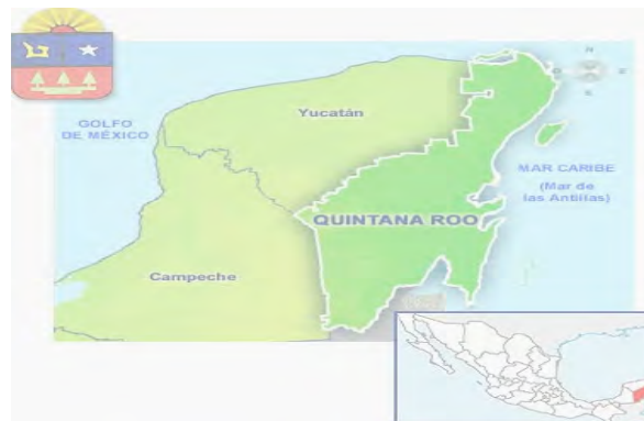
Imagen 1.

El Estado de Quintana Roo se encuentra en el este-sureste de la República Mexicana; al oriente de la Península de Yucatán, frente al Golfo de México y del Mar Caribe o Mar de las Antillas (Ver imagen 1).