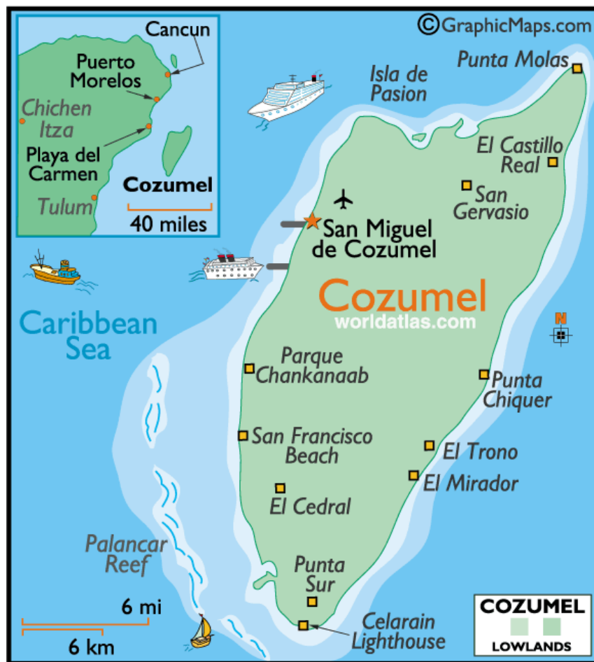
Fig. 5 Mapa de Cozumel

A continuación, en la Figura 5 se presenta un mapa de localización de la ciudad de Cozumel, que ilustra su ubicación geográfica: