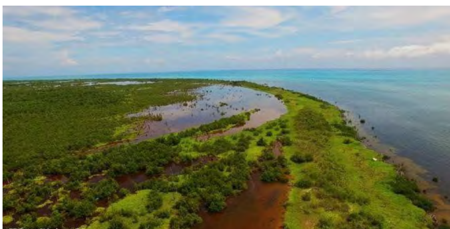
Figura 1 Área Natural Protegida. Reserva de la Biosfera Banco Chinchorro en Quintana Roo

A través de este marco contextual, se establece la base para comprender la relevancia de abordar el tema de las Áreas Naturales Protegidas en relación con el desarrollo sostenible y, a su vez, plantea la necesidad de desarrollar investigaciones que contribuyan a la conservación de estos espacios valiosos.