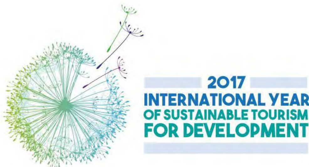
Figura 3 La 70ª Asamblea General de las Naciones Unidas designó al 2017 como el Año Internacional del Turismo Sostenible para el Desarrollo

La contribución que ha tenido de manera internacional la Organización Mundial del Turismo en el desarrollo sostenible es en la noticia “2017, año internacional del turismo sostenible para el desarrollo”, la cual es muy interesante ya que trata sobre la contribución que se realiza para poder forjar el turismo sostenible para el desarrollo, así como el potencial que tiene para ayudar a alcanzar la Agenda 2030; citando al secretario general Taleb Rifai que manifestó lo siguiente: “Es una oportunidad única para construir un sector turístico más responsable y más comprometido, que pueda capitalizar su inmenso potencial en términos de prosperidad económica, inclusión social, paz y entendimiento, y preservación de la cultura y el medio ambiente” según la OMT, 2017.