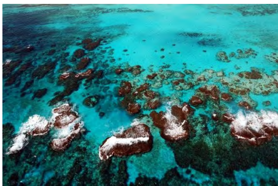
Figura 2 Área de Protección de flora y fauna del Norte de la Isla Cozumel

La contribución que ha tenido de manera internacional la Organización Mundial del Turismo en el desarrollo sostenible es en la noticia “2017, año internacional del turismo sostenible para el desarrollo”, la cual es muy interesante ya que trata sobre la contribución que se realiza para poder forjar el turismo sostenible para el desarrollo, así como el potencial que tiene para ayudar a alcanzar la Agenda 2030; citando al secretario general Taleb Rifai que manifestó lo siguiente: “Es una oportunidad única para construir un sector turístico más responsable y más comprometido, que pueda capitalizar su inmenso potencial en términos de prosperidad económica, inclusión social, paz y entendimiento, y preservación de la cultura y el medio ambiente” según la OMT, 2017.