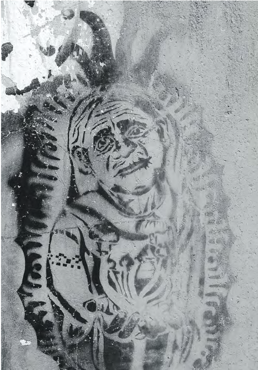
Figura 1. Sacerdotisa Maria Sabina (Huatla, 2018)