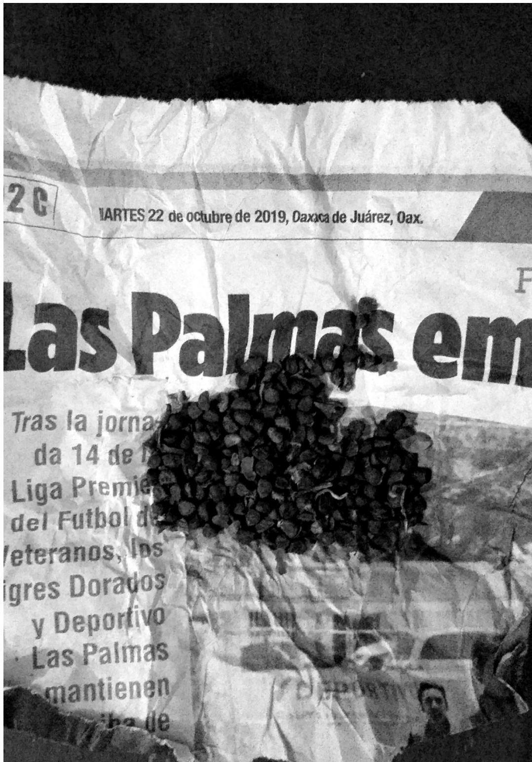
Figura 6. Semilla de la Virgen (Huautla, 2019)