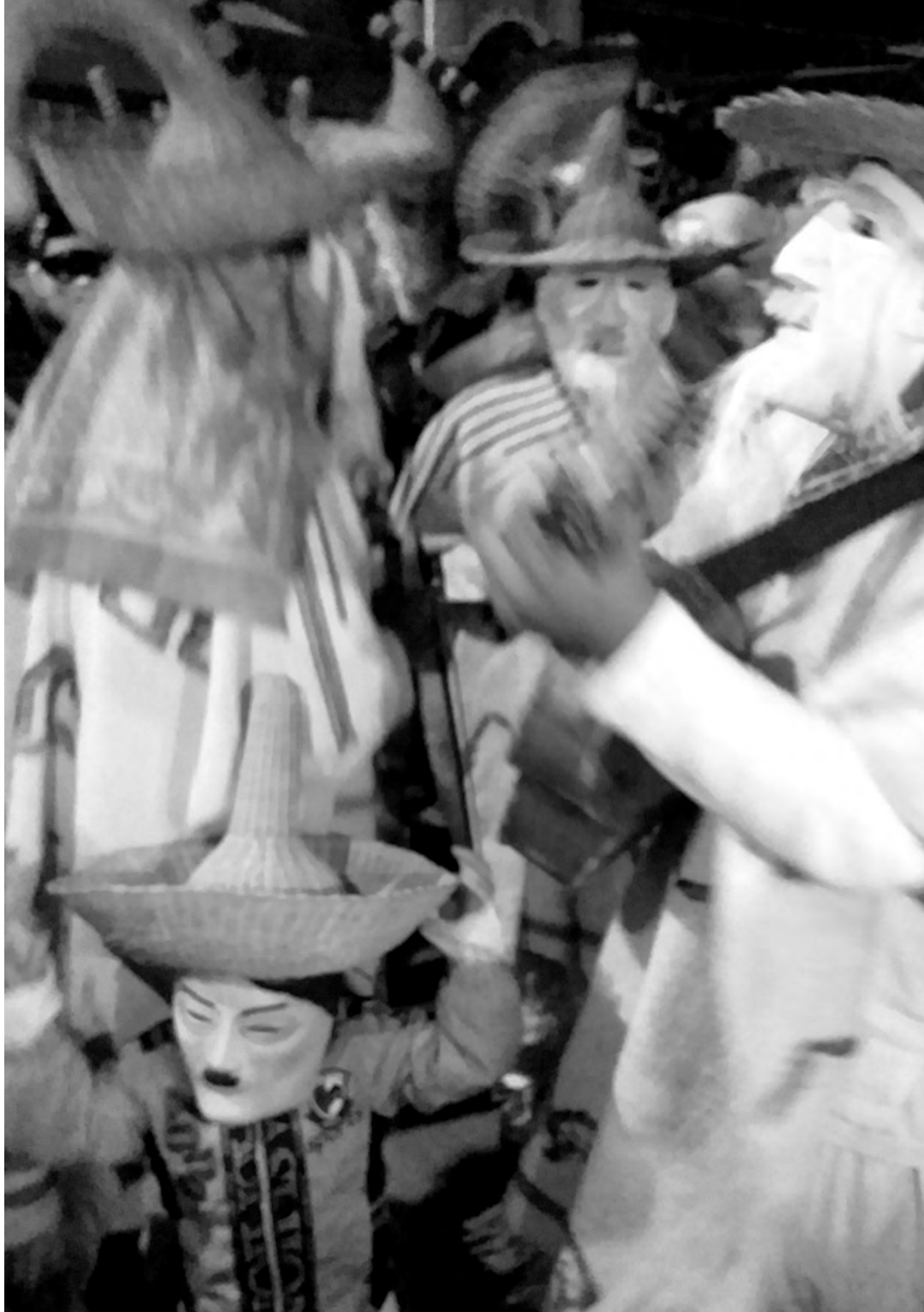
Figura 5. Sui K' en concentración de grupos de huehuentones en el Palacio Municipal (Huautla, 2019)