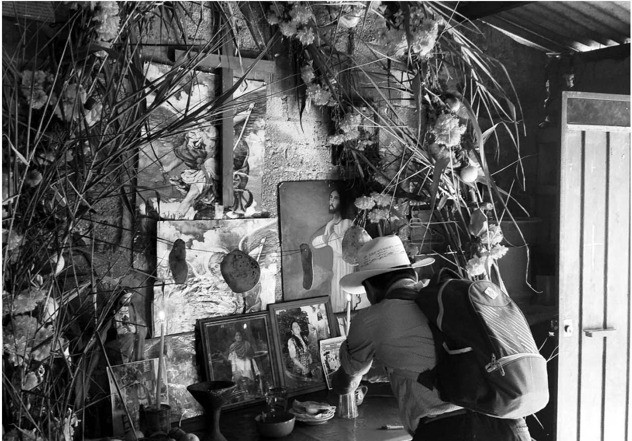
Figura 7. Ofrenda a una de las trece abuelas del mundo Julieta Casimiro (Huatla, 2019)