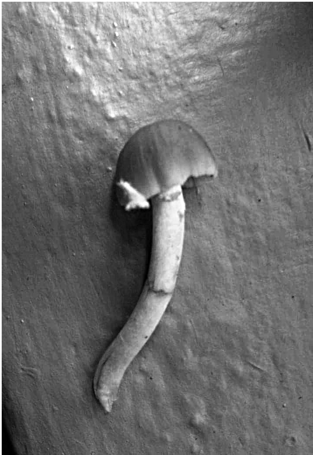
Figura 4. Santitos (Huautla, 2020)