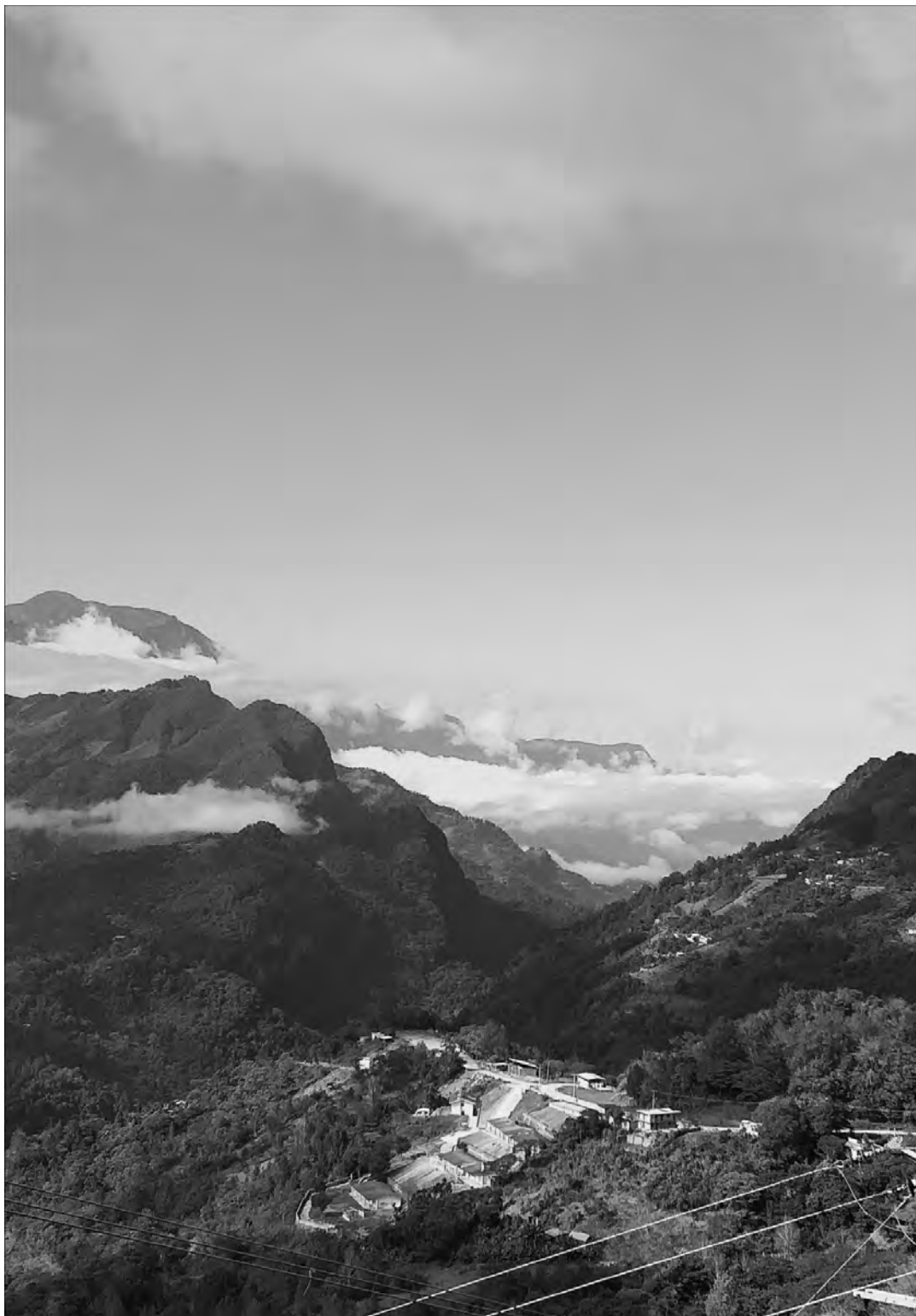
Figura 2. Nindo Tokoso (Huautla, 2018)