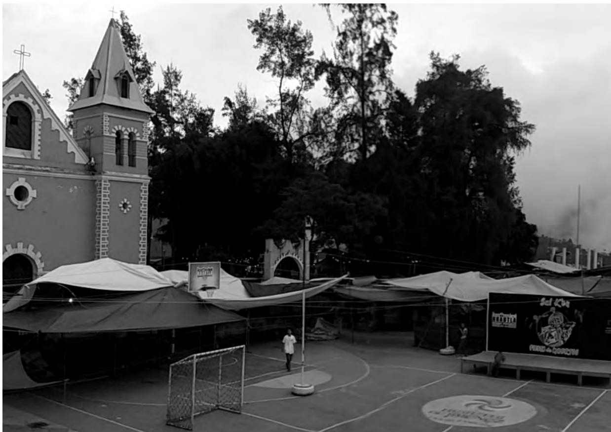
Figura 10. Vista desde el Palacio Municipal de Huautla de Jiménez (Huautla, 2019)