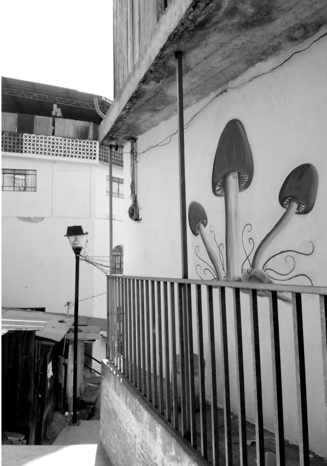
Figura 9. Callejones de Huautla (Huautla, 2019)