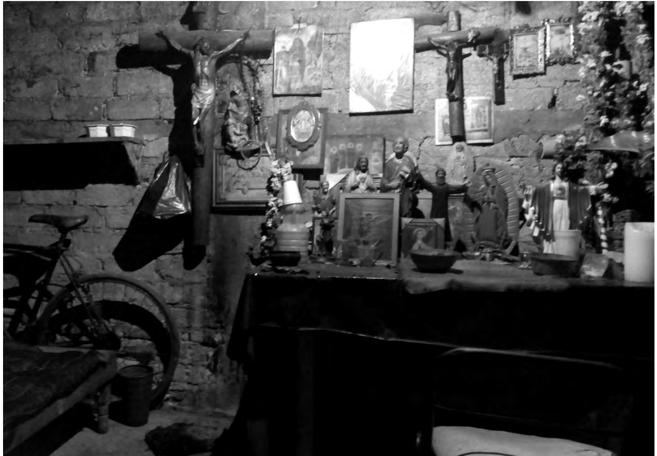
Figura 3. Espacio para las veladas mazatecas (Huautla, 2018)