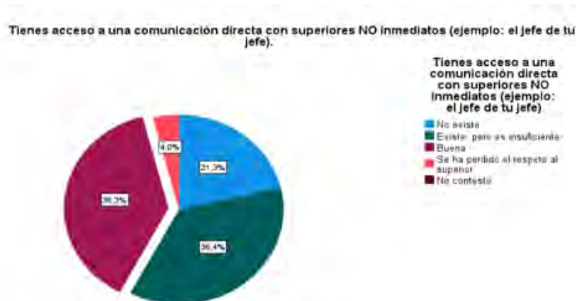
Figura 4. Comunicación en la corporación