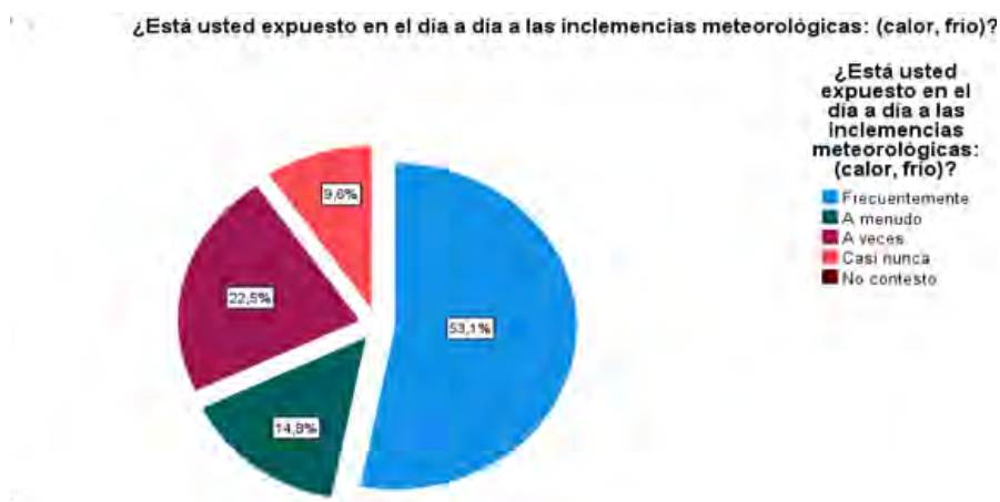
Figura 1. Exposición de los policías a las inclemencias del tiempo