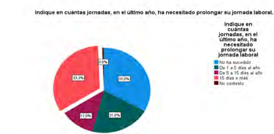
Figura 2. Jornada laboral prolongada