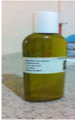
Repelente contra el mosquito, elaborado con semilla de limón, albahaca y aceite de olivo, medicina tradicional maya