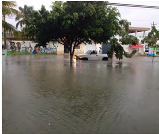
La agua estancada después de fuertes lluvias en Chetumal, hace que proliferen los moscos con zika, fotografía cedida por Jorge Gamboa, septiembre de 2016