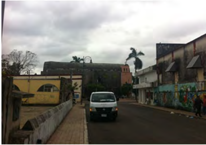
Calles con basura, se observa en Carrillo Puerto, en junio de 2015