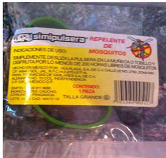
Pulseras para combatir el mosco transmisor del zika en Quintana Roo, septiembre de 2016