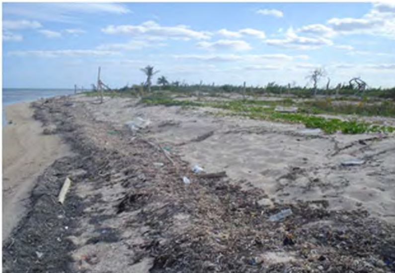
Crisis ambiental, se observa basura en una playa cerca de Mahahual, sur de Quintana Roo, 2012