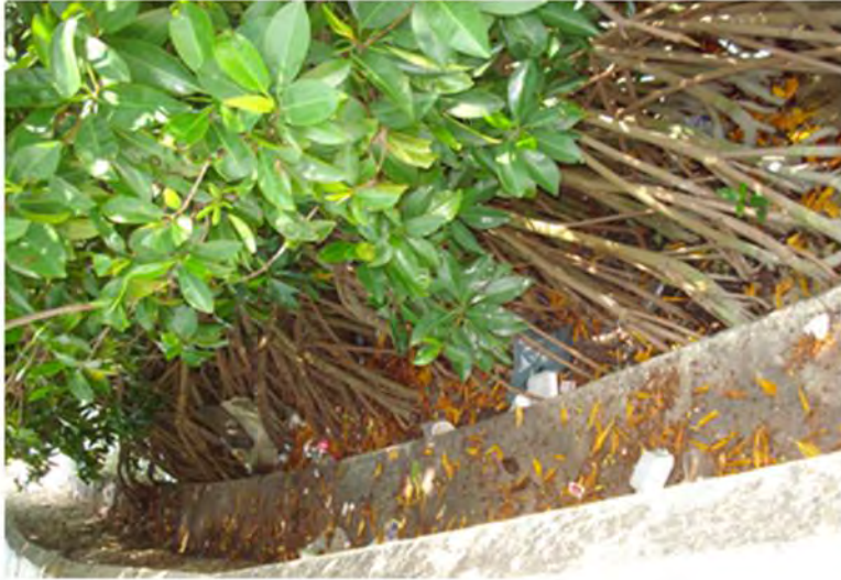
Crisis ambiental, basura en el Boulevard de Chetumal, 2012