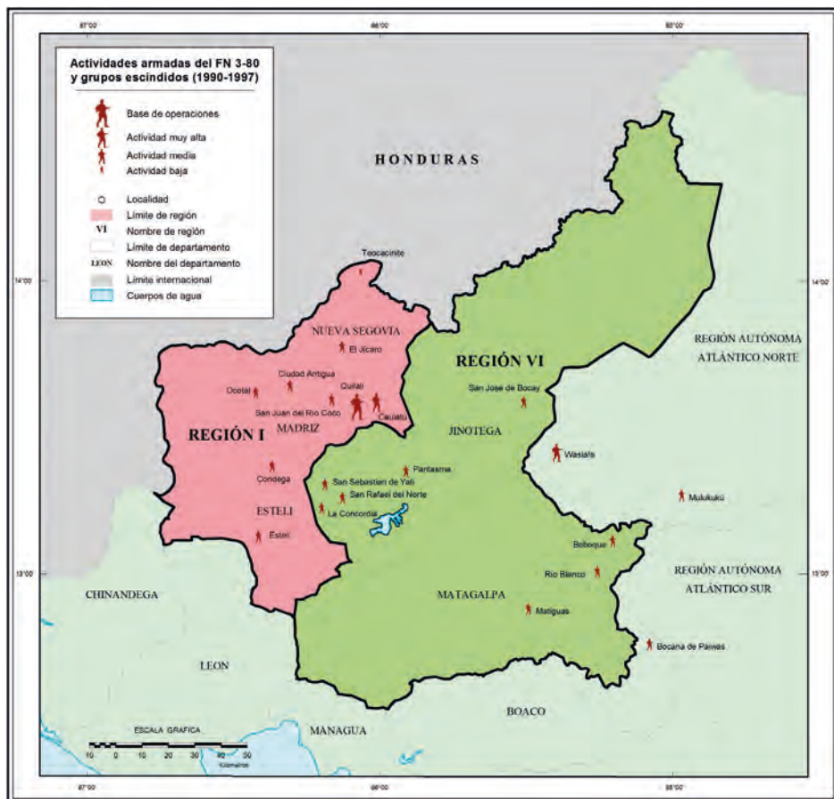
Mapa 2. Área de actividades armadas del FN 3-80 y grupos escindidos (1990-1997)

Fuente: Elaboración propia utilizando QGIS 2.8