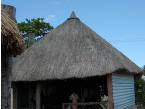
Figura 2. Palapa de k'oxolaak en San Crisanto, Yucatán, México